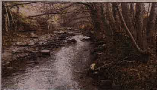
El Flamisell el dia 8 de gener d'enguany. Pràcticament sec

La Fiscalia de Medi Ambient de Madrid ha obert diligències contra la companyia Endesa per presumpte delictes ecològics al riu Flamisell, al Pallars Jussà, segons ha pogut saber l'ACN. Aquesta investigació per part de la Fiscalia arriba dies després que la CUP de la Vall Fosca denunciés (8 de gener), que durant unes hores les elèctriques havien assecat pràcticament el riu en plena fresada de la truita. La formació ho va fer a través de les xarxes socials i posteriorment als Agents Rurals. La Fiscalia ha fet saber directament a la CUP que obre les diligències per presumpte delictes ecològics per incompliment de condicions de les concessions. La central de Capdella té un cabal ecològic fixat