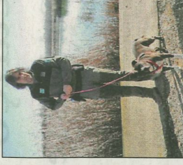
Moment en el que va ser capturat

Capturen un gos solt a l'Estany d'Ivars i Vila-sana