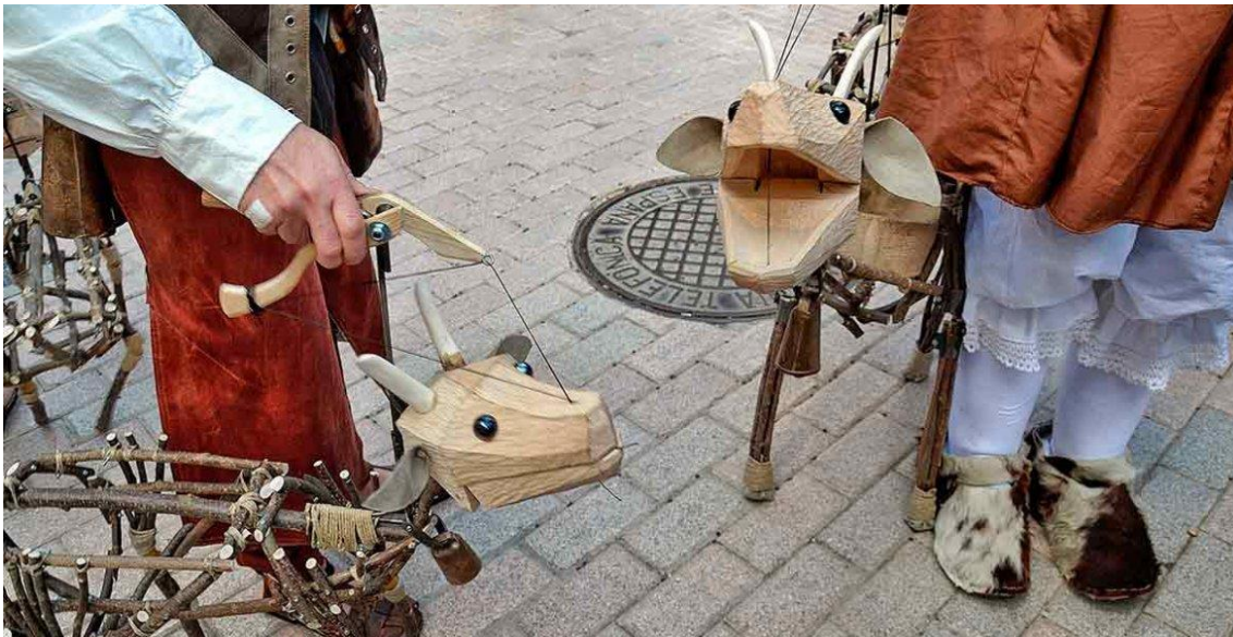
Funció d'espectacle "El repòs de la Transhumància"

Activitats Culturals Subvencionades per la Diputació de Lleida - Institut d'Estudis Ilerdencs per un import de 5.699,00€