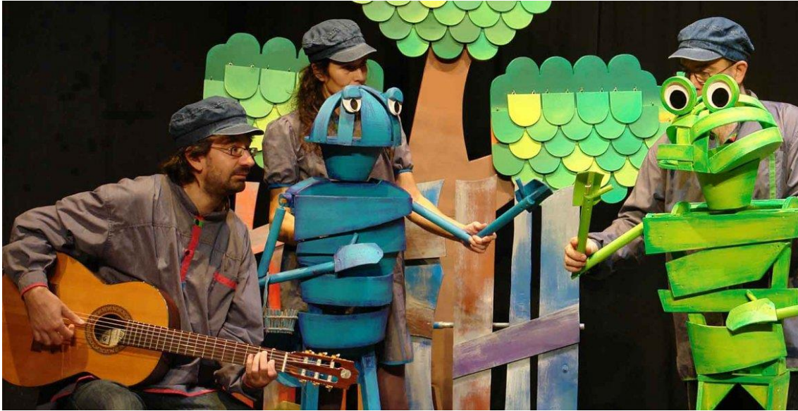
Funció d'espectacle, "La cigala i la formiga"