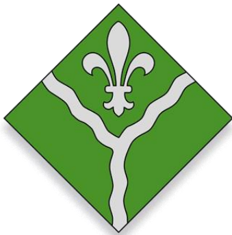
EMD ARTIES E GARÒS