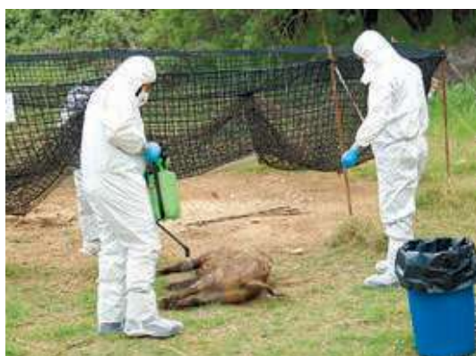
Els Rurals desinfecten un senglar abatut en una zona afectada per la PPA

Tot i això, els esforços de les administracions i del sector continuen donant els seus fruits i hi ha països que de manera pro-